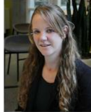
Roseriet Beijers Radboud University